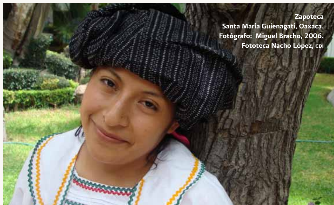
Zapoteca Santa María Guienagati, Oaxaca. 2006.