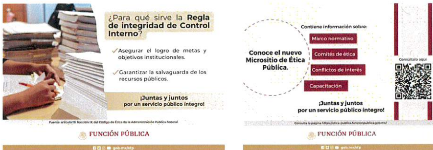
Las imágenes que se señalan son una muestra representativa.

Con la finalidad de resaltar la importancia de la ética pública de las personas servidoras públicas del Gobierno Federal, la UCMAPF y el Comité de Ética, difundieron mediante correo electrónico al personal del INALI, información para sensibilizar al personal sobre la actuación en el ejercicio de sus funciones.