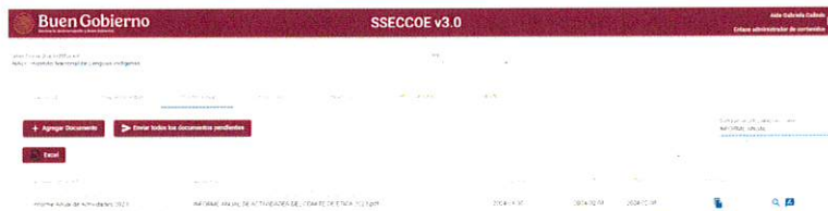
La imagen que se señala es una muestra representativa.

Con fecha 31 de enero de 2024, se incorporó al SSECCOE el Informe Anual de Actividades 2023 del Comité de Ética.