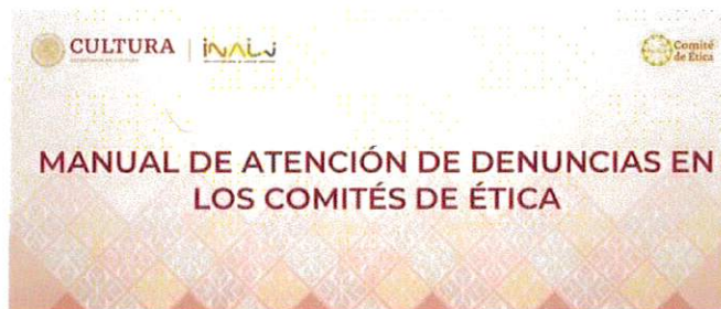
La imagen que se señala es una muestra representativa.

El CE no recibió solicitudes de asesoría u orientación en las materias de ética pública y conflictos de intereses durante el ejercicio 2024; sin embargo, mediante correo electrónico se difundió a todo el personal del INALI material de sensibilización.