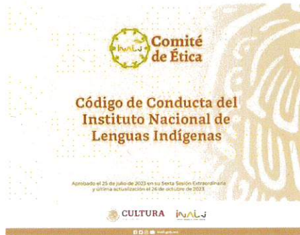
La imagen que se señala es una muestra representativa.

https://dof.gob.mx/nota_detalle.php?codigo=5735323&fecha=06/08/2024#gsc.tab=0